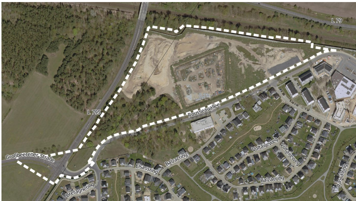
Geltungsbereich des Bebauungsplans Nr. 46 (ohne Maßstab)

Die Abgrenzung des Geltungsbereiches ist im folgenden Kartenausschnitt dargestellt: